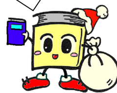
毛呂山町立図書館キャラクター ブックサンタ